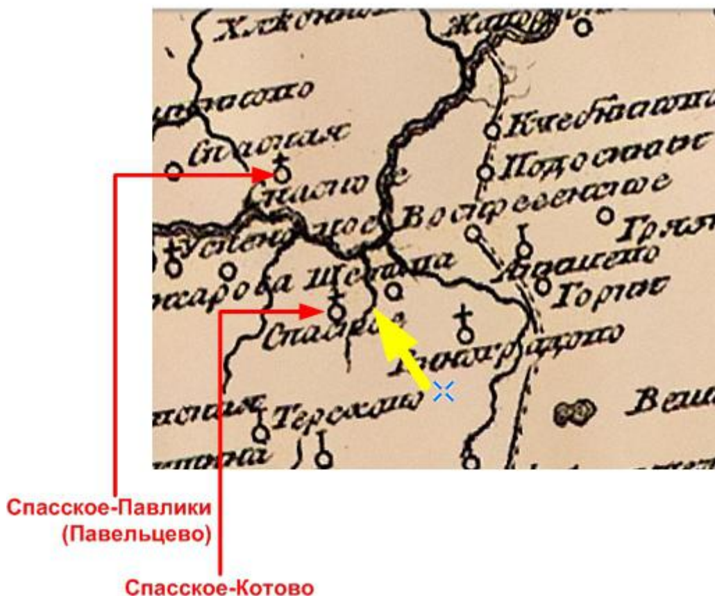
Географическая карта Московской провинции Горихвостова 1774 г.

Понятное дело, что на берегу реки Коть село должно носить название Котово. Однако почему оно изначально называлось Курлыково?